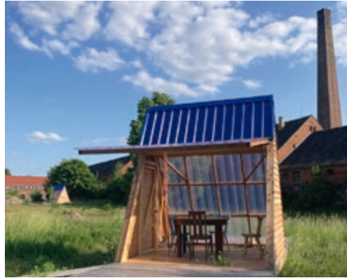
Naturnaher Arbeitsort auf einem ungenutzten Hofgelände

Noch mitten in der Coronapandemie wurde viel darüber diskutiert, wie der Umgang mit der Pandemie die Arbeitswelt verändert. Vor allem die Büroarbeit stand dabei im Fokus. Zwei gegensätzliche Pole schienen sich in den Debatten gegenüber zu stehen: Die einen sahen leerstehende, verfallene Bürokomplexe in der Stadt, die nicht mehr gebraucht würden, weil alle im Homeoffice arbeiten würden. Andere sahen genau darin ein wertvolles Gelegenheitsfenster für eben diese Stadtquartiere. Denn gerade große Städte kämpfen mit Wohnraumknappheit. Die freierwerdenden Immobilien könnten genutzt werden für Wohnungen für Studierende, Gemeinschaftsunterkünfte für Geflüchtete sowie Räume für Vereine und öffentliche Einrichtungen. Oder sie könnten dazu genutzt werden, energetische Sanierungen in Innenstädten voranzutreiben. Eventuelle Abrisse würden schließlich der Versiegelung entgegenwirken. Das