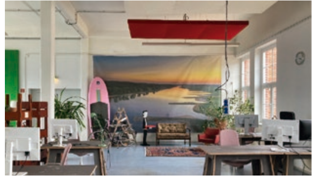
Coworking Space in einer ländlichen Mittelstadt

üblicherweise nicht mit der Funktion „Arbeit“ verbunden werden, wie eben der schattige Garten einer Freundin im Sommer. Im Alltag der Wissensarbeiter*innen erfüllt jeder Arbeitsort eine eigene Funktion. In der Abbildung sind Funktionszuschreibungen, die in den Interviews regelmäßig auftauchen, mit einem Symbol markiert. Zusammen bilden die Orte ein multilokales Netzwerk, das die Räumlichkeit heutiger Wissensarbeit weit besser beschreibt als die verbreitete Dualität von Büro und Homeoffice.