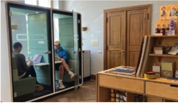
Schalldichte Telefon- und Videocallboxen in einem umgebauten Gutshof